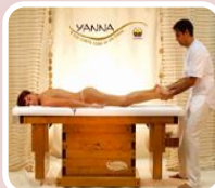
Rituale del massaggio