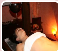
Trattamenti specifici per il corpo